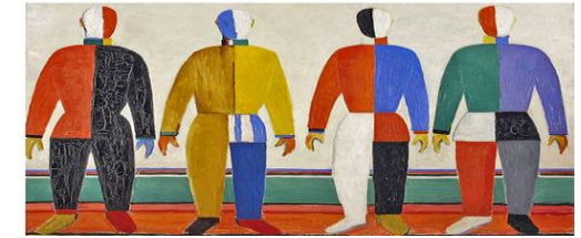
Kasimir Malevitch, Les Sportifs , Saint Pétersbourg, 1930

« Русский язык универсален - он может быть строгим, как математика, и размытым, как акварель ». Б. Томашевский, литературовед. » « La langue russe est universelle : elle peut être sobre, comme les mathématiques, et floue, comme une aquarelle. » Boris Tomacheskiy, spécialiste en littérature.