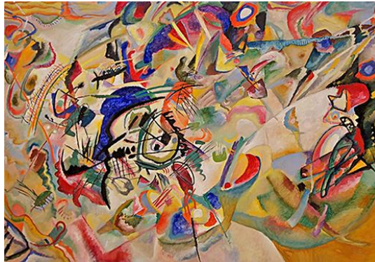
Vassily Kandinsky, Composition no 7 , Moscou, 1913